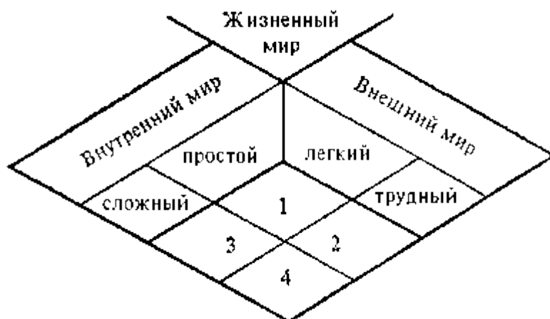
Типология жизненных миров.

Структура этой типологии такова: "жизненный мир" является предметом типологического анализа. Он имеет внешний и внутренний аспекты, обозначенные соответственно как внешний и внутренний мир. Внешний мир может быть легким либо трудным. Внутренний — простым или сложным. Пересечение этих категорий и задает четыре возможных состояния, или типа "жизненного мира".