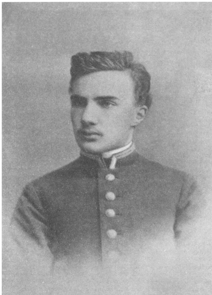
Г.П.Федотов в гимназические годы. Начало 1900-х годов